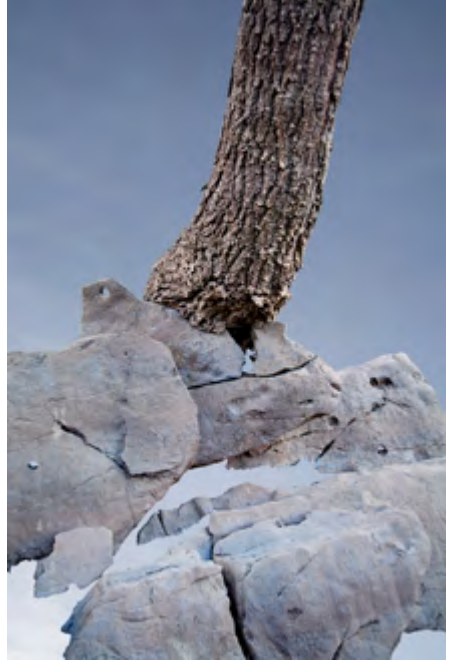
© Antonio Guerra Casquero Ganador edición 2018

En su memoria, la escuela convoca anualmente estas becas para fomentar el estudio de la fotografía y facilitar el desarrollo de jóvenes fotógrafos.