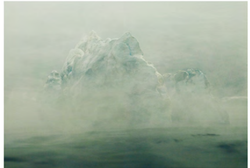
“Gris soñador de bruma, desvela tu recuerdo. Que hable tu alma helada”

Practicaremos los ejercicios utilizados en las dos primeras partes y presentaremos nuevos juegos encaminados a ampliar, estructurar y definir nuevos contenidos de nuestros proyectos.