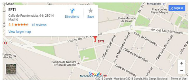
Etiquetas: bernardo franco, colectivos marginados, efti, guatemala, humanitario, solidario, una foto en la recamara

“Una Foto En La ReCámara” se inaugura hoy, día 20 de Mayo, en la escuela de fotografía EFTI y podrá visitarse hasta el próximo 5 de junio.