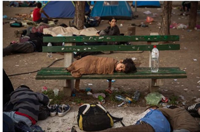
Un niño duerme en el parque Bristol en Belgrado, Serbia.

Compartir Facebook Twitter G+ 4 Me gusta