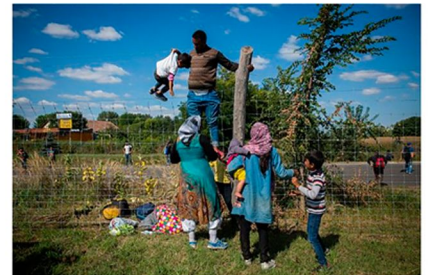
Una de las imágenes del trabajo sobre refugiados del fotógrafo Olmo Calvo.

Precisamente el pasado jueves, la CEAR (Comisión Española de Ayuda al Refugiado) presentó su informe anual 2016. De todo su desasossegado análisis de la situación, un resumen en cifras: "En el último lustro, la diáspora del pueblo sirio ha llevado al mundo a conocer el mayor exodo desde el fin de la Segunda Guerra Mundial, en 1945. En mayo de 2016 la guerra civil en este país ya había forzado el exilio de 4.843.285 personas refugiadas y el desplazamiento interno de 7,6 millones de personas. ACNUR estima que la cifra de desplazamiento forzado en el mundo debió de superar en 2015 los 60 millones de personas, reflejando un año más una realidad sin precedentes. De estas casi 60 millones de personas, 19,5 millones eran refugiadas, 38,2 millones desplazadas internas y 1,8 millones solicitantes de asilo. De las 19,5 millones de personas registradas como refugiadas, el 51% son menores de 18 años".