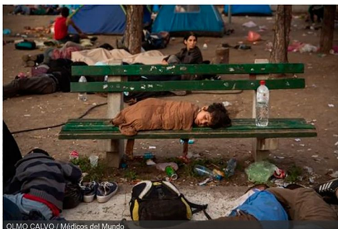
OLMO CALVO / Médicos del Mundo