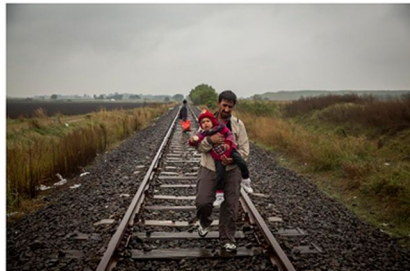
Un padre y su hijo caminan por las vías del tren en Hungría, a pocos metros de la frontera con Serbia.

"Pero ningún pacto, ley o alambra terminan con las causas que provocan esas migraciones. Sólo sirven para mantener lejos a las personas que sufren las consecuencias: supervivientes de guerras, bombardeos y situaciones de pobreza que buscan en Europa un refugio que se les niega", dice el fotógrafo , que, después de ser testigo durante tantos meses del trato de policías y militares europeos a esos refugiados, cree que lo mínimo, mínimo que debería hacer Europa es tratar con respeto y dignidad a esa gente, y no con gas-pimenta, que hasta a él le alcanzó en los ojos. Recordemos aquí la patética cifra de los refugiados que han llegado a España de todo ese flujo humano: poco más de un centenar.