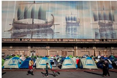
Campo de tiendas de campaña en Grecia.