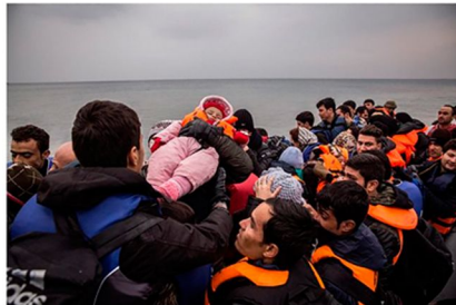
Una imagen del trabajo sobre refugiados del fotógrafo Olmo Calvo.