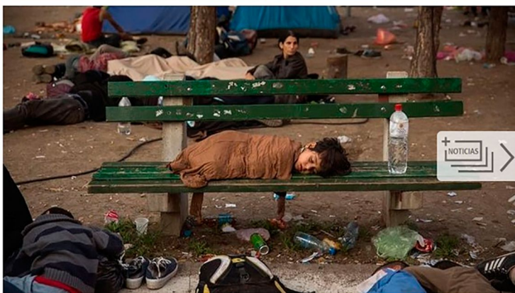
Una exposición con fotografías de Olmo Calvo reflejan el éxodo de miles de personas por la 'ruta de los Balcanes' MADRID | EUROPA PRESS