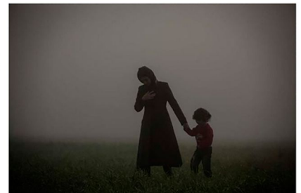
Una madre y su hijo.

'Artículo 14' , de Olmo Calvo . En Escuela EFTI , con la colaboración de Médicos del Mundo . Del 17 de junio al 27 de julio.