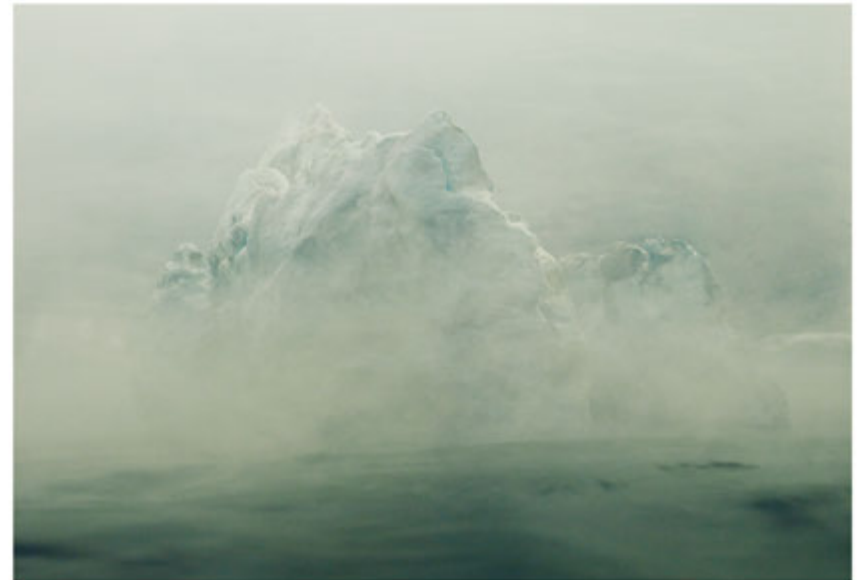
“Gris soñador de bruma, desvela tu recuerdo. Que hable tu alma helada”

Practicaremos los ejercicios utilizados en las dos primeras partes y presentaremos nuevos juegos encaminados a ampliar, estructurar y definir nuevos contenidos de nuestros proyectos.